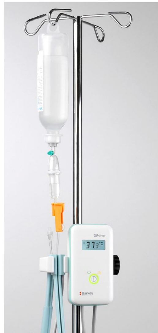
Das dargestellte Zubehör ist nicht Bestandteil der Lieferung.